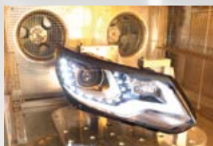
Prueba de calor