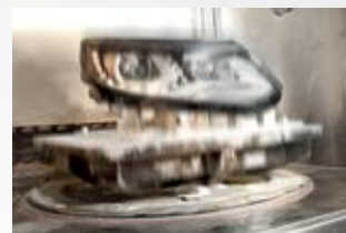
Prueba de vibración