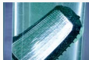
Prueba de inmersión y fuga