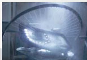
Prueba de lavado a presión