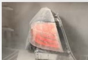
Prueba de polvo