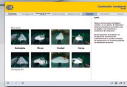
Entrenamiento en línea de HELLA