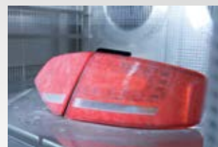
Prueba de humedad y frío